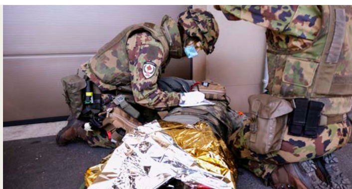
Eine Angehörige des Medical-Teams von SWISSCOY 44 beim Reassessment des Verletzten und Ausfüllen des Übergaberapports.