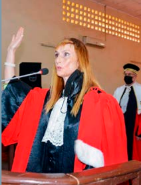
Les deux juges d'instruction suisses ont prêté serment le 24 mars 2021 à la Cour pénale spéciale pour la Centrafrique à Bangui.