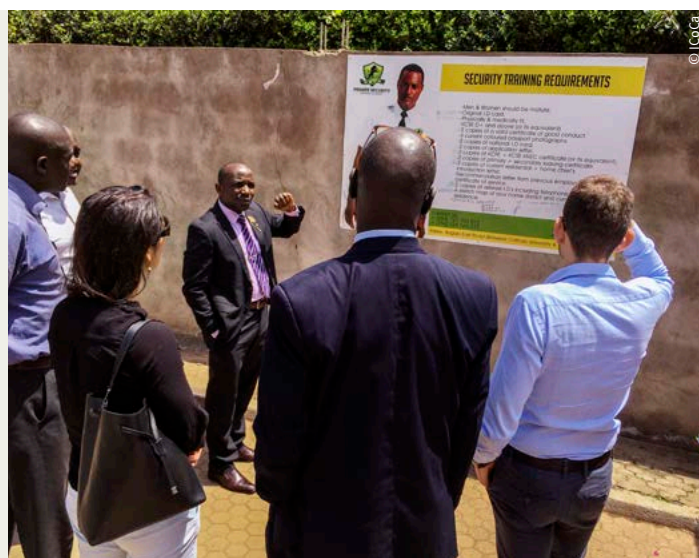
Während der Ostafrika Reise im November 2019 besuchten Mitglieder des ICoCA Sekretariats ebenfalls die Private Security Training Academy (PSTA) in Nairobi, Kenia.