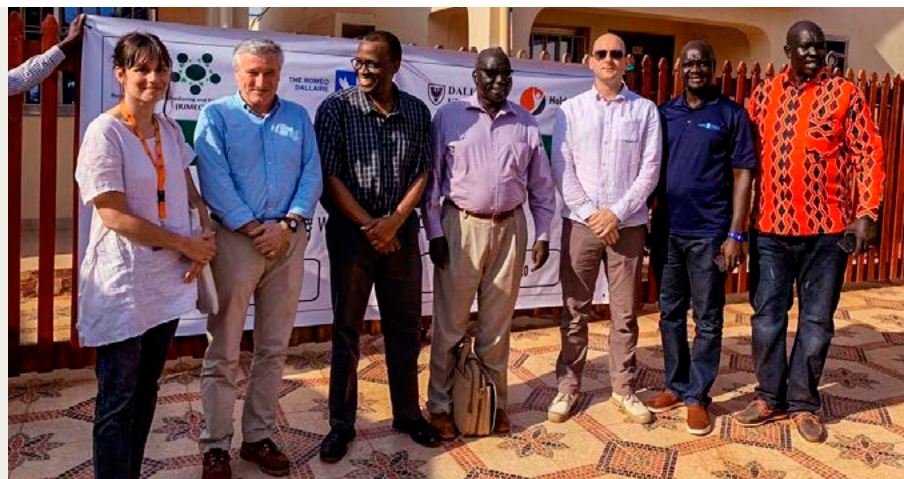
An der RJMEC-Informationsveranstaltung in Wau (Südsudan) im Januar 2020 waren auch die Roméo Dallaire Foundation sowie die lokale Regierung vertreten. (Marc Dietrich, 3.v.r.)