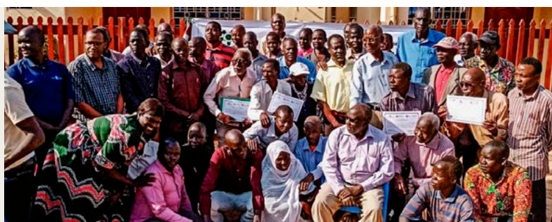
An der RJMEC-Informationsveranstaltung von 2020 in Wau, der zweitgrössten Stadt Südsudans, nahmen zahlreiche Lehrerinnen und Lehrer teil.

Fin 2013, soit deux ans à peine après la proclamation de l'indépendance du Soudan du Sud, le pays sombrait dans une guerre civile sanglante, dont le bilan s'élève aujourd'hui à plus de 400 000 victimes. La signature de l'accord de paix en 2018 a mis fin dans une large mesure aux combats. Mais la rivalité entre le président Salva Kiir et son vice-président Riek Machar n'a jamais cessé et leur lutte pour le pouvoir entrave la mise en place des institutions de l'État. La RJMEC, instituée par l'accord de paix de 2018 pour en surveiller et en évaluer la mise en oeuvre, est également chargée de soumettre des propositions au gouvernement de transition. Elle doit rendre compte à cet égard aux chefs d'État des pays membres de l'organisation des États dans la Corne de l'Afrique (IGAD). Cette entité diplomatique neutre et indépendante, qui emploie une cinquantaine de personnes originaires du monde entier, est financée par divers États ainsi que par l'UE. La RJMEC soutient tous les six chapitres de l'accord de paix. La mise en place des institutions étatiques doit permettre, conformément à l'accord de paix, la tenue en décembre 2021 des premières élections libres au Soudan du Sud. Mais le chemin vers une paix durable semble encore long et les élections devront très probablement être reportées.